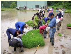
6月 苗取りをして 田植え