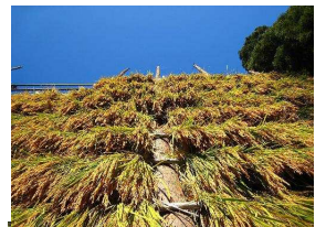
10月 空を見上げた あっばれ！