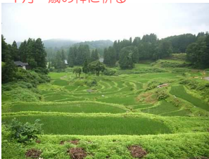
7月 蛍の恋の季節 蛙草も元気いっぱい！