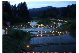
6月 晴に灯りをともす