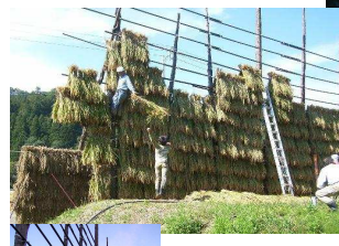
10月 はさ掛け izzardって 全力投球！